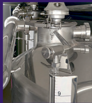
Stainless steel upper manways with vent valve