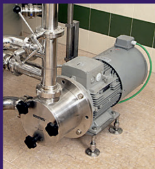
Stainless steel low-speed pump