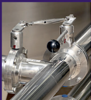
Stainless steel three-way butterfly valves