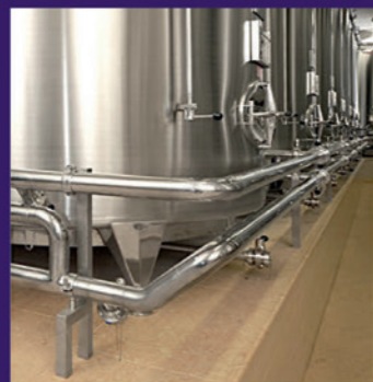
Stainless steel piping