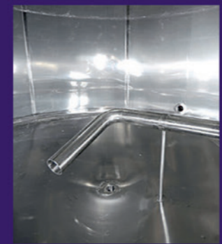
Inside view of stainless steel racking decanting arm