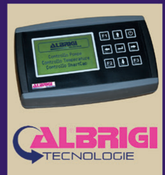
Wireless remote control