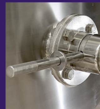
Outside view of stainless steel racking decanting arm