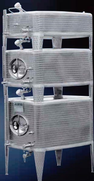
Serie di serbatoi Compatank da hl 3-5-10, indipendenti per lo stoccaggio sovrapposti fissi