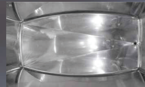
Vista dall'alto di interno di Compatank con bordi e angoli arrotondati facili da pulire e con fondo sagomato autoscaricante