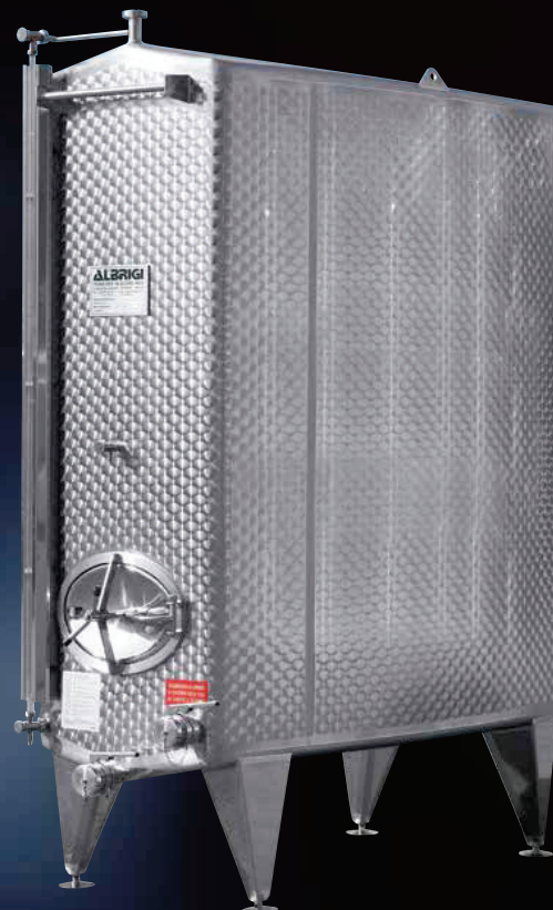
Serbatoio di stoccaggio e di fermentazione con spigoli arrotondati e pareti leggermente bombate per sfruttare lo spazio