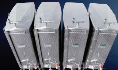
Batteria di Compatank predisposti di impianto di azoto per la vendita dei vini sfusi