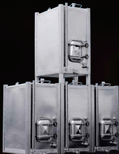
Serbatoi Compatank modello sovrapponibile