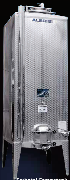
Serbatoi Compatank stretto e alto