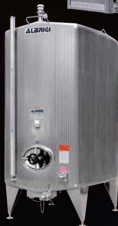
Serie di serbatoi Compatank da hl 50 costruito su misura per lo stoccaggio vini