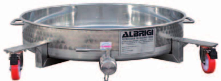
I Mastella inox ribassata su ruote di varie capacità da lt 200 a lt 1500