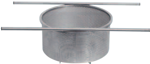
I Setaccio mobile in lamiera forata inox