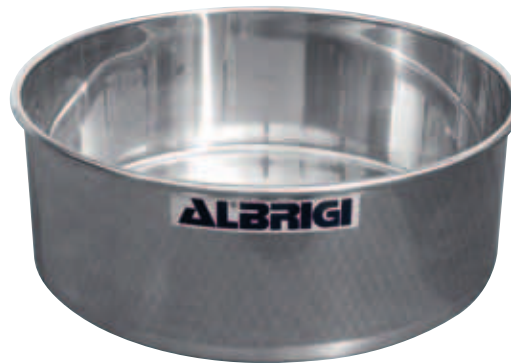
I Mastelle inox di varie capacità da lt 200 a lt 1500