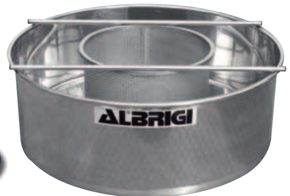
I Setaccio a rete inox per separare i vinaccioli durante la fase di scarico dei mosti