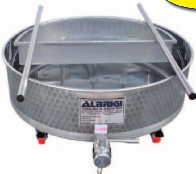
I Mastella con mezzo setaccio inox su ruote