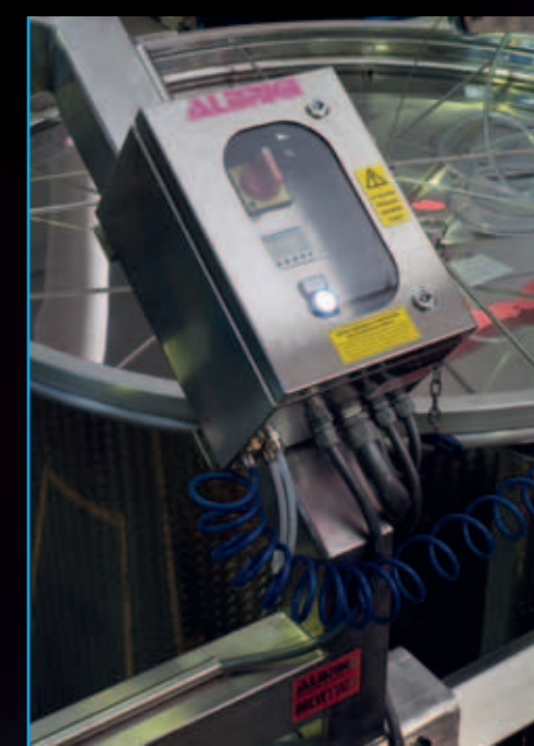
Quadro di comando elettropneumatico di salita e discesa manuale -automatico