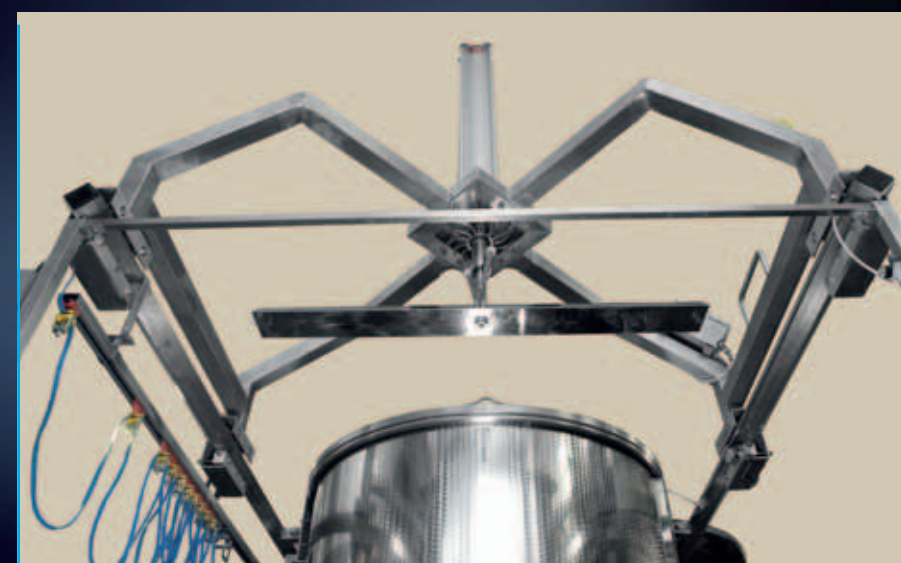
Vista di pala autorotante brevettata