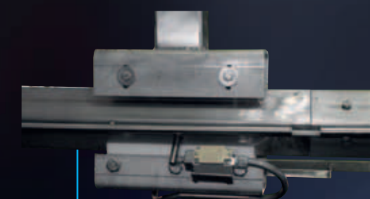
Vista di sistema di bloccaggio con sicurezza a Norma