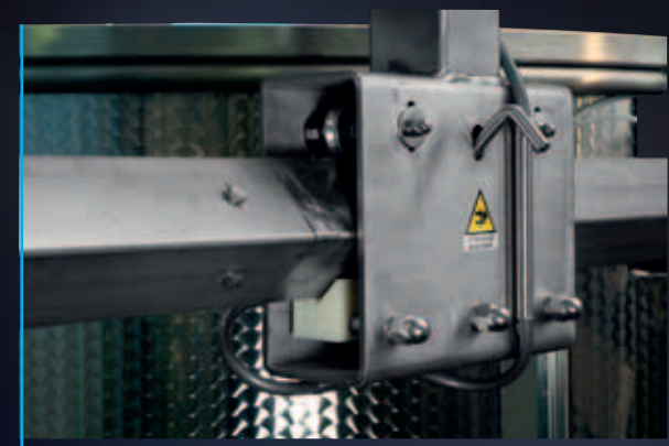
Vista di carrello scorrevole su rotaia