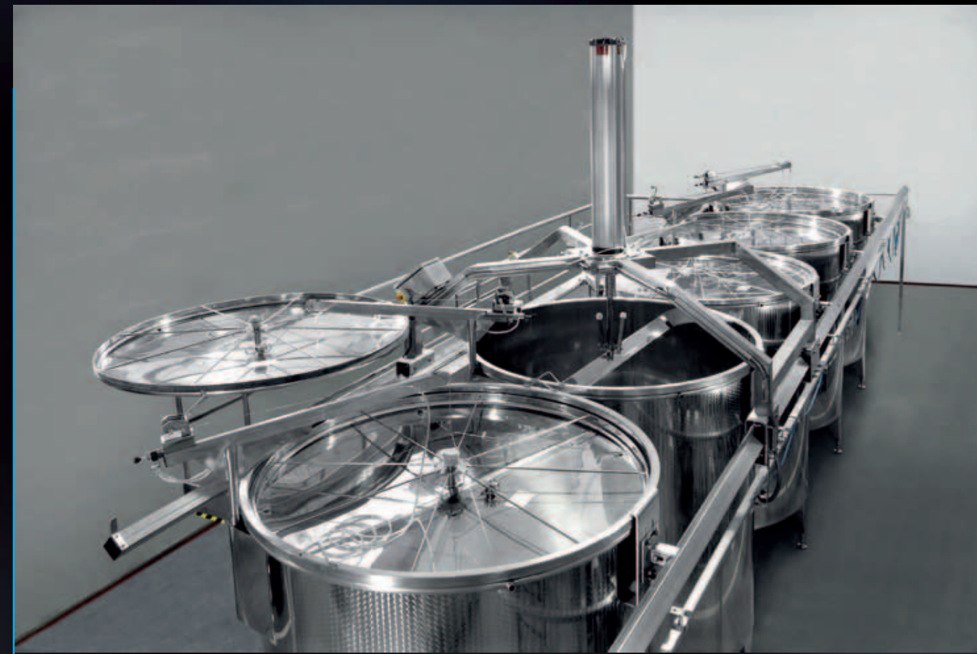
Follatore a pala rotante su doppia rotaia funzionante in manuale o automatico