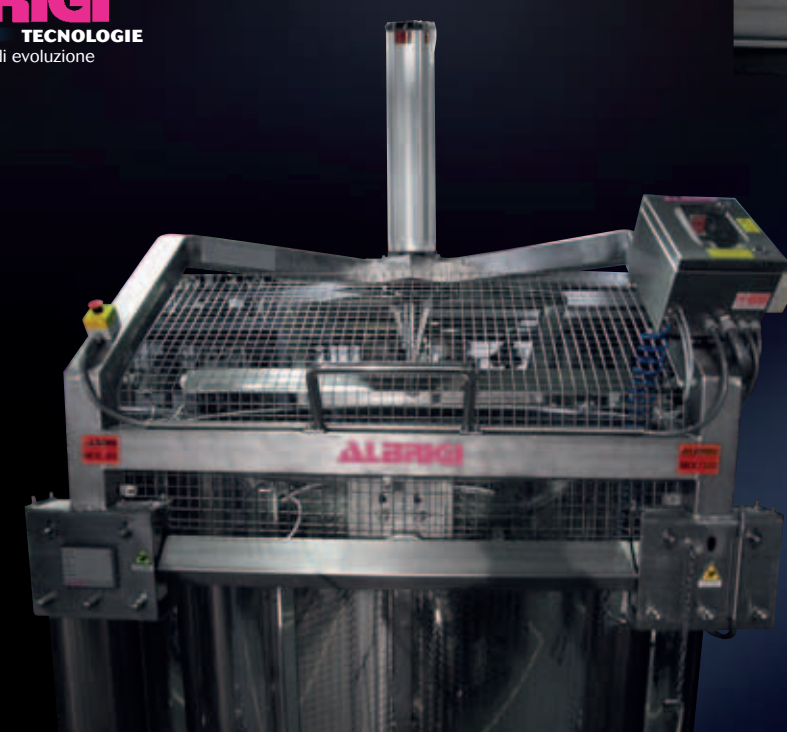
Vista di timone di guida avanti - indietro