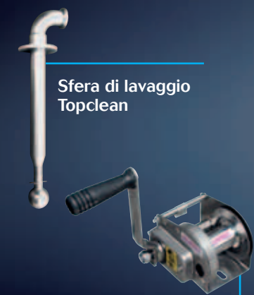
Sfera di lavaggio Topclean