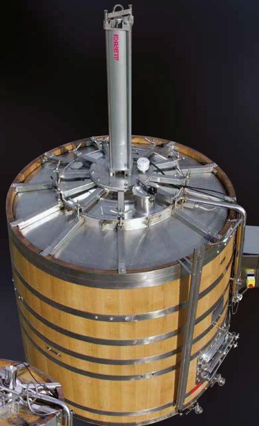
Vista di sistemi di rinforzo del cielo in acciaio e di legno su tini di legno con meccanismo Monofolltank