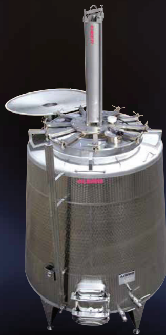
Vista dall'alto di cielo di tino con meccanismo di Monofolltank