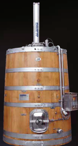
Monofolltank su tino di legno a tronco di cono