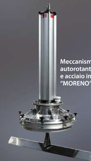
Meccanismo "Monofolltank" autorotante per tini in legno e acciaio inox, brevettato "MORENO"