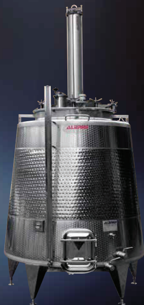
Monofolltank su tino di acciaio a tronco di cono