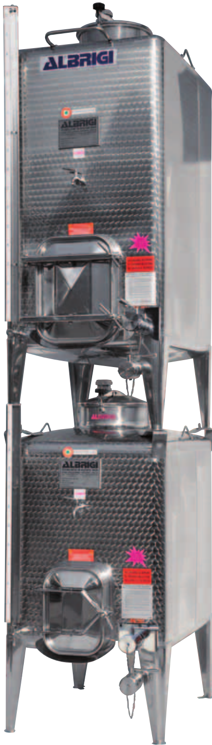
I Pluritank da lt 1000 e lt 1500