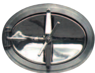
I Portello ovale da mm 440x340