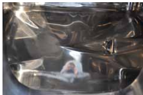
I Scarico totale stampato nel fondo