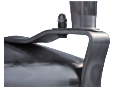
PASSA DALLE PORTE LARGHE 950 MM