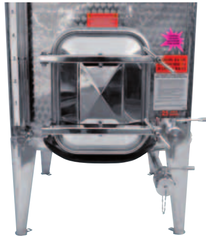
I Portello rettangolare a filo fondo