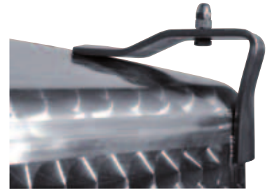
I Staffe di ancoraggio del sebatoio superiore