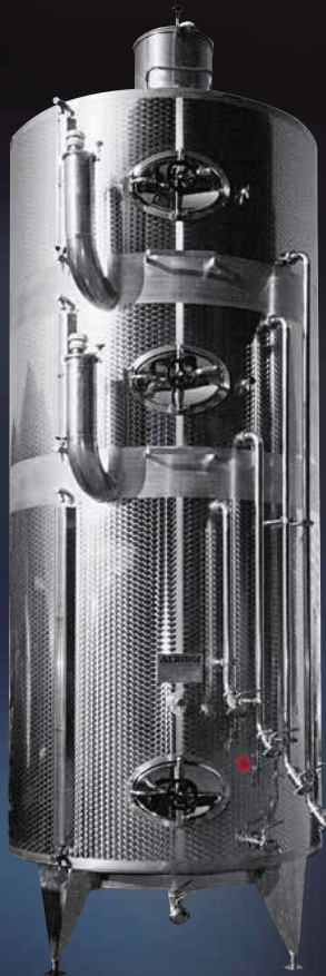
Politank da hl 50+25+25 completo di tutti gli accessori