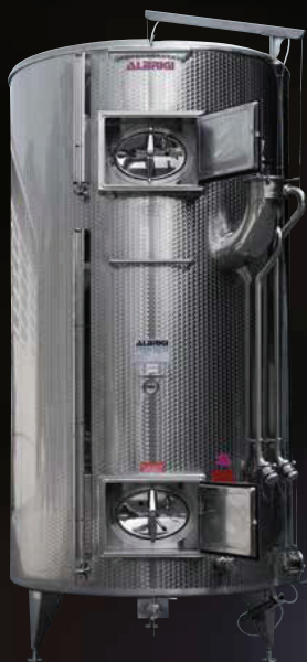
Politank a due scomparti termocondizionato con Termostar e isolato con Isotank con scomparto superiore Variotank da 25 a 50 hl