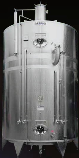
Politank da hl 200 + 100 con impianto di lavaggio Cleanfix, e scarichi totali e parziali degli scomparti prolungati in basso