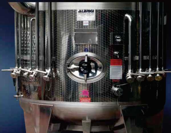
Valvole di servizio per gli scomparti superiori di un Politank a tre scomparti con scarico totale, parziale, lavaggio, azoto e rimontaggio