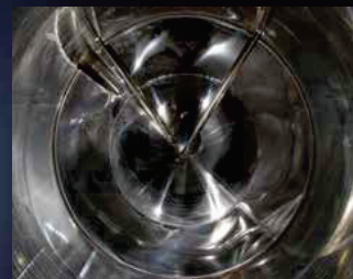
Vista dal basso di fondo brevettato Albrigi Superbottom con canali di sfiato aria del chiusino