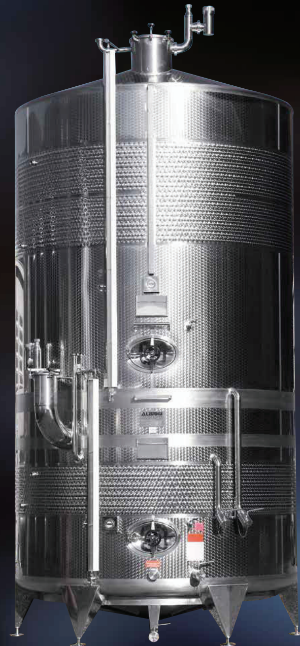
Politank da hl 100 + 200 completo di tutti gli accessori