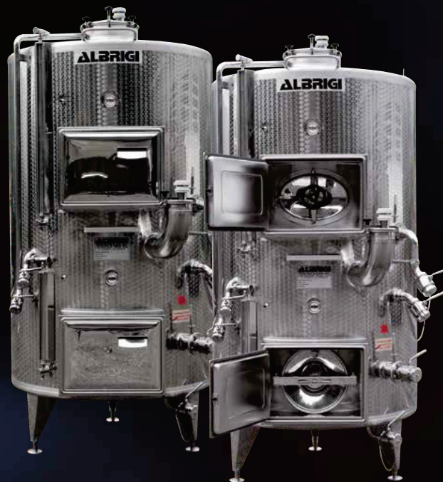
Politank termocondizionati con Termostar e isolati con Isotank per la fermentazione e lo stoccaggio