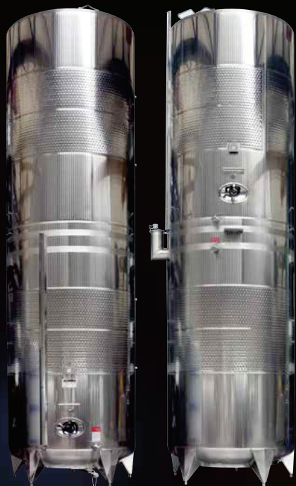
Due Politank Termo da hl 150 + 150 con porte e accessori contrapposti