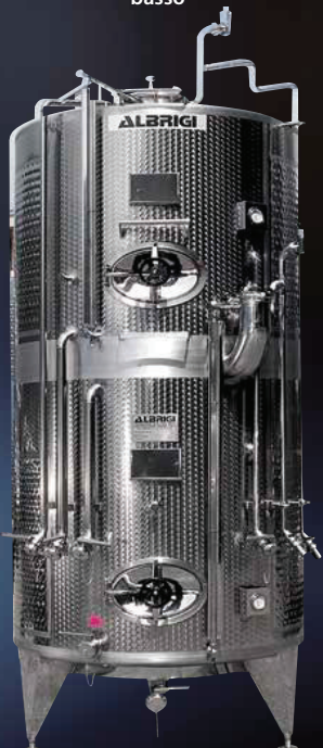
Politank Termo da hl 60+ 40 con impianto di lavaggio Cleanfix e Innergas