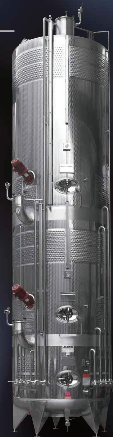
Politank a tre scomparti da hl 50 +100+150, completo di tutti gli accessori