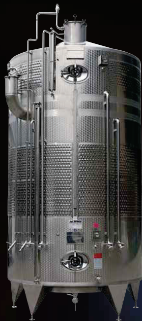
Politank termocondizionato con Termostar da hl 150 + 50, completo di accessori