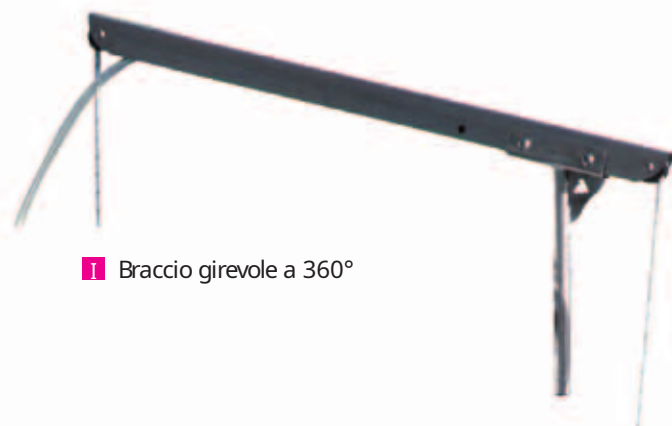
■ Braccio girevole a 360°