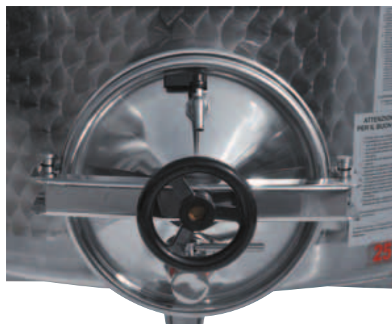
■ Portello ø 300 mm posta a filo fondo apertura esterna