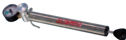
■ Pompa piccola mobile da lt 295 a lt 1470