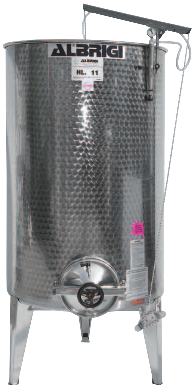
■ SP Mini da lt 1100 completo di tutti gli accessori