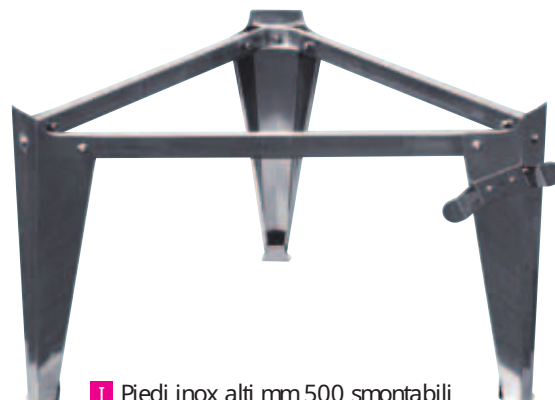
■ Piedi inox alti mm 500 smontabili