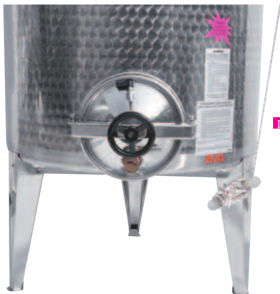
■ Fondo piano poggiate su piedi inox mobili