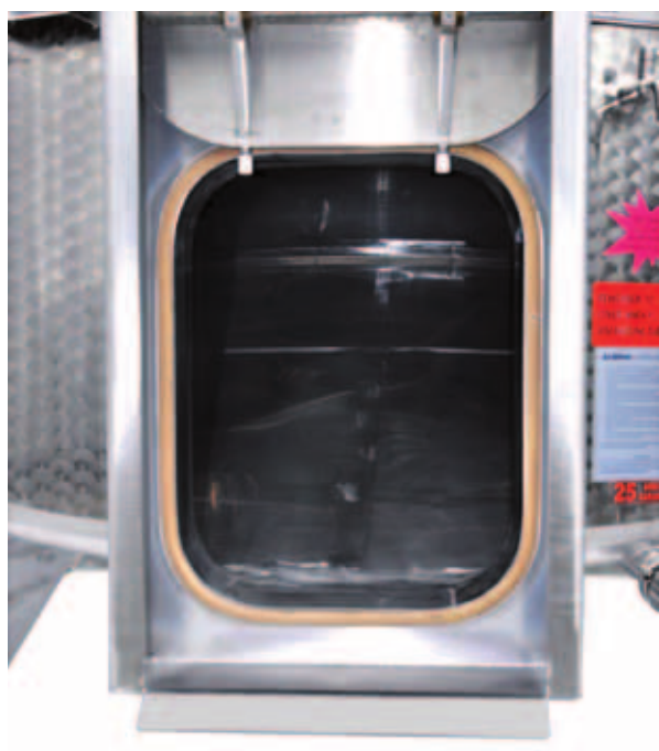
I Porta a ghigliottina da mm 400 x 500 a f lo fondo