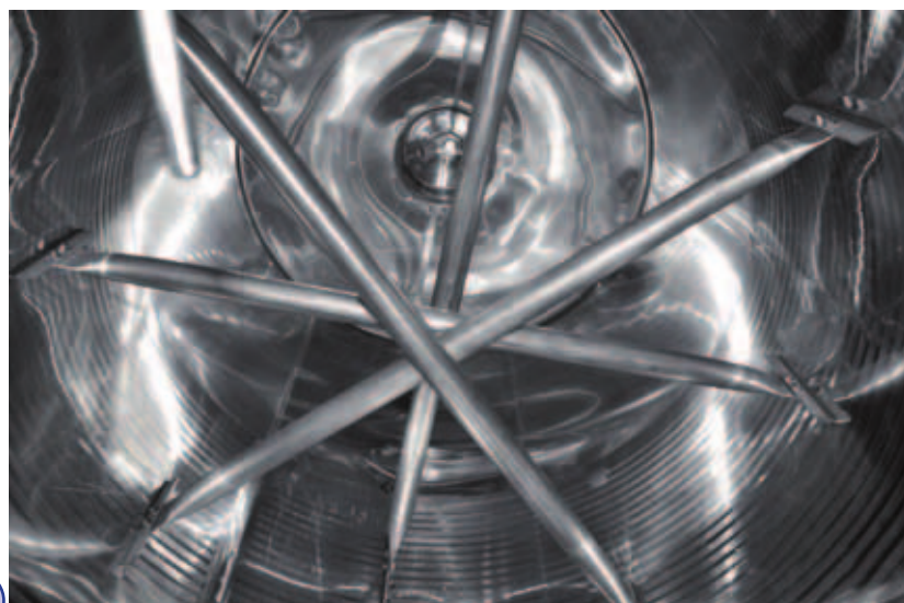
1 Pali rompicappello per fare il DELASTAGE