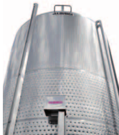
T Vista frontale del SPECIALTANK "S"