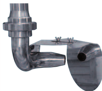
T IRRORTANK irroratore autorotante, autopulente, per mosto