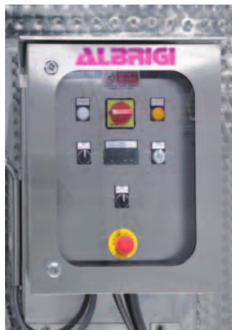
T Quadro elettrico di comando delle fasi di rimontaggio della pompa