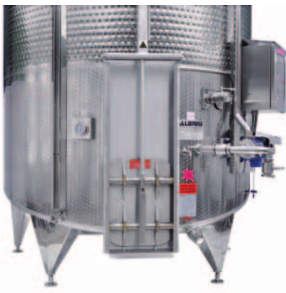
1 Porta rettangolare a ghigliottina elettrica