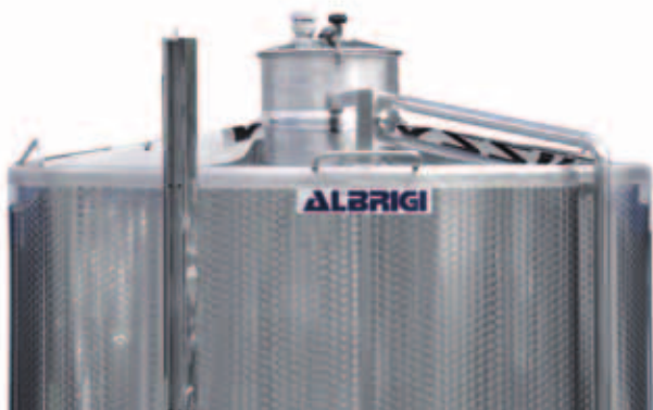
T Chiusino \varnothing 400 mm centrale