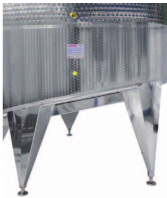
I Fondo piano inclinato da 15° a 30°