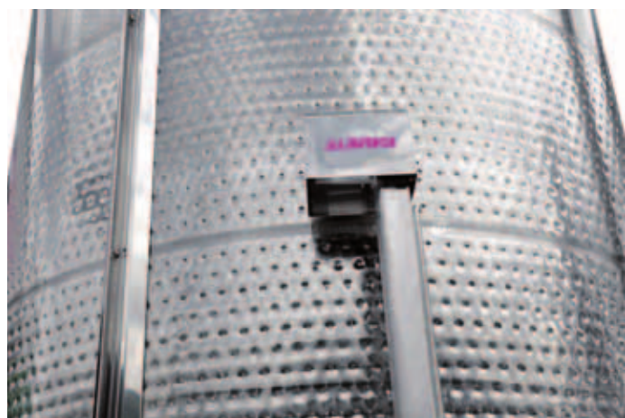
1 Vista del motore che attiva la chiusura e l'apertura della porta a ghigliottina