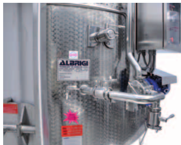
T Pompa di rimontaggio collegata al tubo di rimontaggio con il quadro elettrico