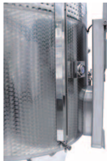
1 Porta a ghigliottina poco sporgente