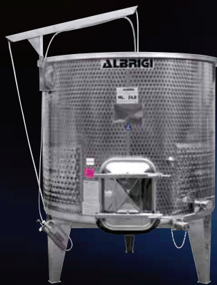
Variotank Termo basso e largo per la fermentazione