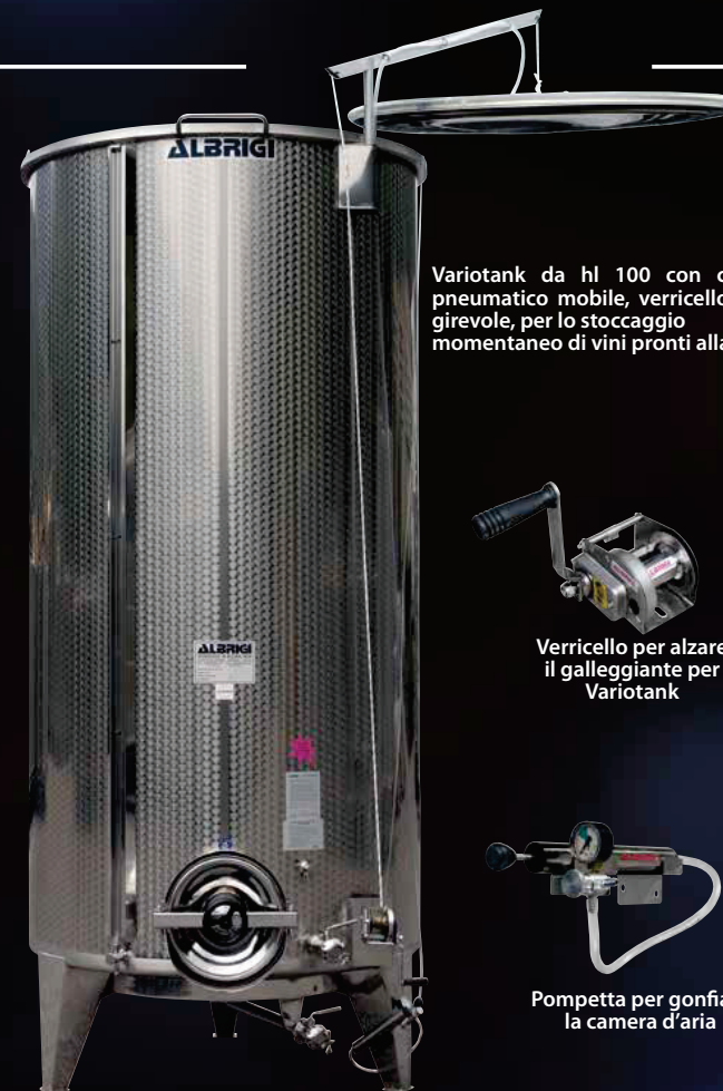
Variotank da hl 100 con coperchio pneumatico mobile, verricello, braccio girevole, per lo stoccaggio momentaneo di vini pronti alla vendita