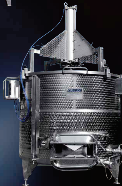
VariotankTermo per la fermentazione con meccanismo di follatura mobile e regolabile per diversi diametri