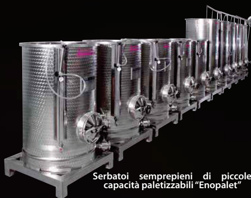
Serbatoi semprepieni di piccole capacità paletizzabili "Enopalet"