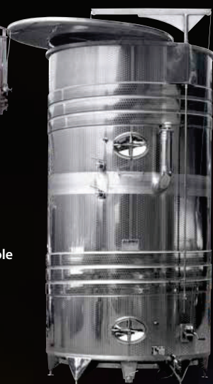
Politank con piano alto Variotank termocondizionato con Termospiral