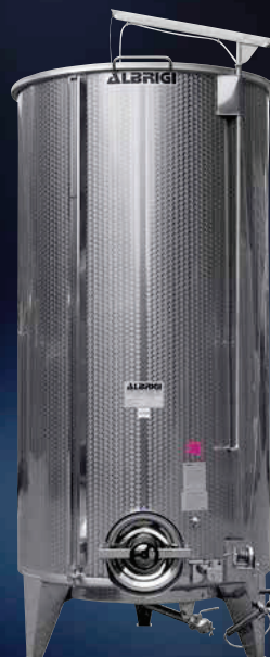
Variotank è un semprepieno classico per lo stoccaggio. Questo modello è completo di leva per ruotare il coperchio pneumatico comodo all'operatore