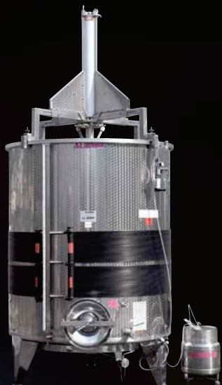
Variotank con Polifascia e Monofolltank mobile speciale per semprepieni