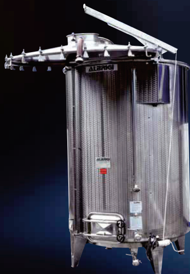
Variotank completo di cielo a chiusura ermetica per diventare un serbatoio standard di stoccaggio. Con questo tipo di coperchio diventa un serbatoio "Combitank"