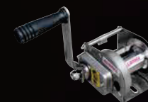
Verricello per alzare il galleggiante per Variotank