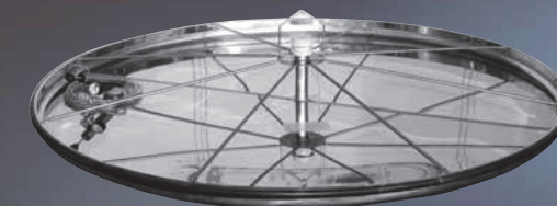
Coperchio mobile con chiusura ermetica pneumatica