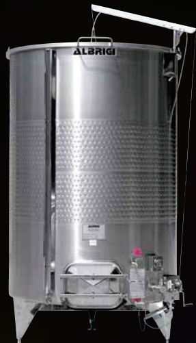
Variotank Termo con finitura esterna satinata fine con SCOTCH BRITE