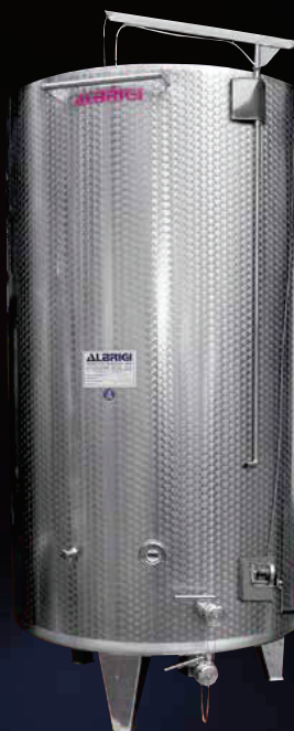
Variotank isolato con Isotank e termocondizionato con Termostar ottimo per la stabilizzazione dei vini