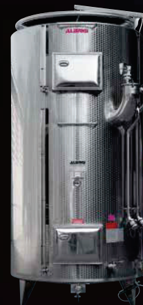
Politank termocondizionato con Temostar e isolato con Isotank con ultimo piano Variotank