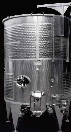
Variotank con due intercapedine Termostar per ottenere freddo e caldo