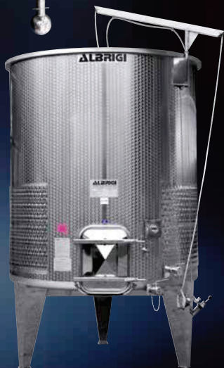
Variotank Termo con intercapedine di condizionamento Termostar bassa