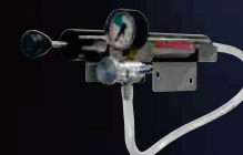
Pompetta per gonfiare la camera d'aria