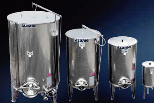
Serbatoi Variotank (semprepieni) da lt 75 a lt 5000 con coperchio antipolvere mobile