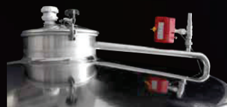
Braccio a ponte