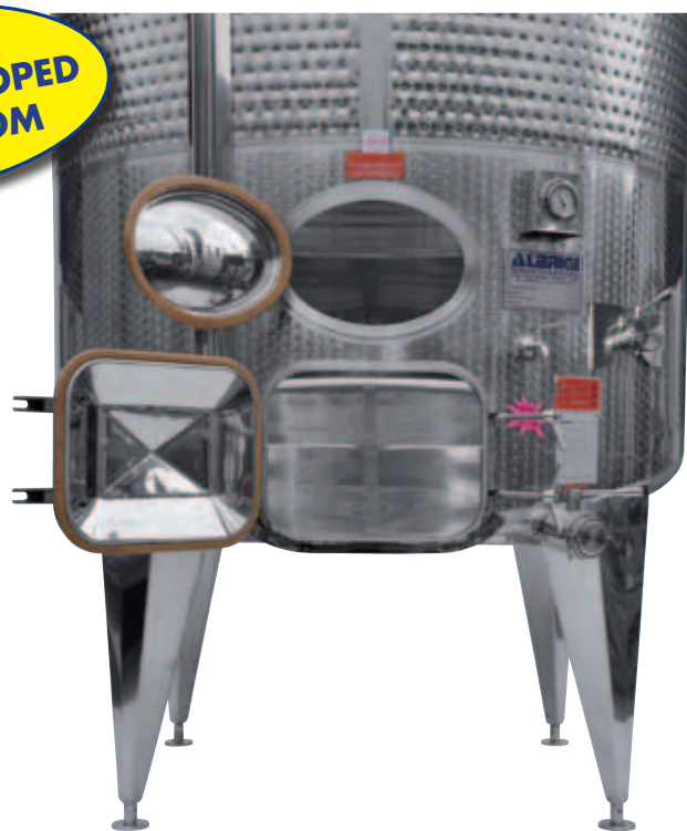
I STEEP BOTTOM: vista frontale con porte rettangolari molto comode per lo scarico delle vinacce GB STEEP BOTTOM: front view with rectangular hatches, which are extremely convenient for the discharge of marc D STEEP BOTTOM: Frontansicht mit rechteckigen und für den Auslass des Tresters praktischen Öffnungen F STEEP BOTTOM: vue de face avec portes rectangulaires, très pratique pour la vidange des marcs E STEEP BOTTOM: foto frontal con puertas rectangulares muy cómodas para la salida de los orujos.